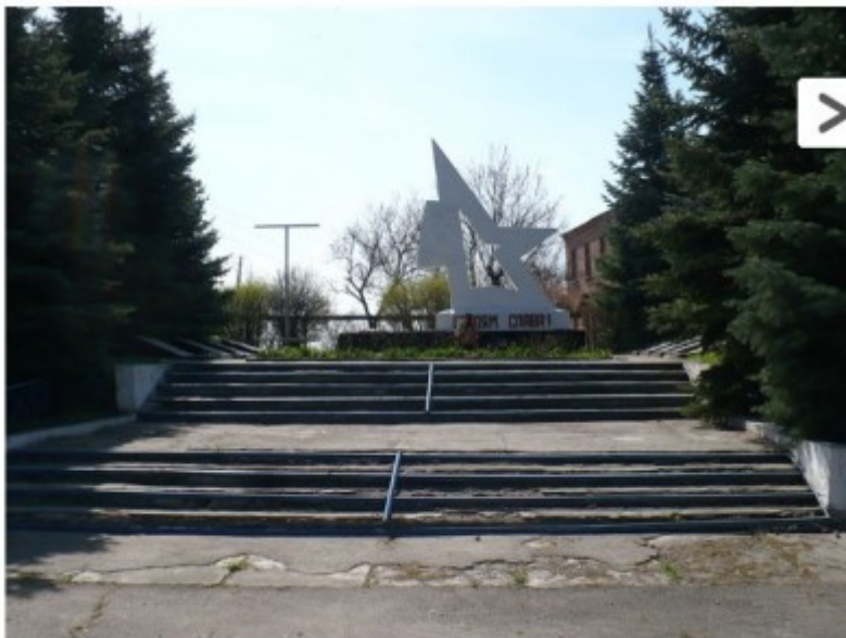
Место захоронения Фадея, награжденного медалью «За боевые заслуги».