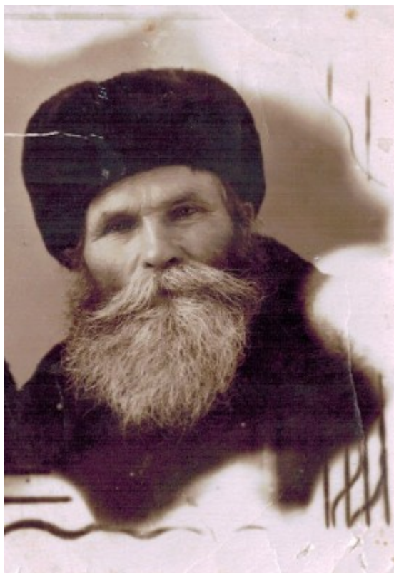
Глава семьи Шелеповых